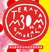
寺山修司没後30年記念認定事業